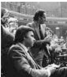
FELIPE GONZÁLEZ Y ALFONSO GUERRA, 1981