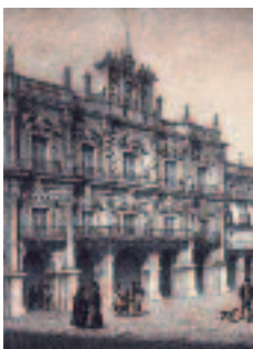
PLAZA DE SALAMANCA